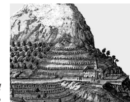
Incisione del XVII secolo

Il convento* dei francescani recolletti* viene fondato nel 1633. Negli anni successivi,