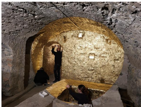
« Lux Aurea » de Georges Rousse, les finitions