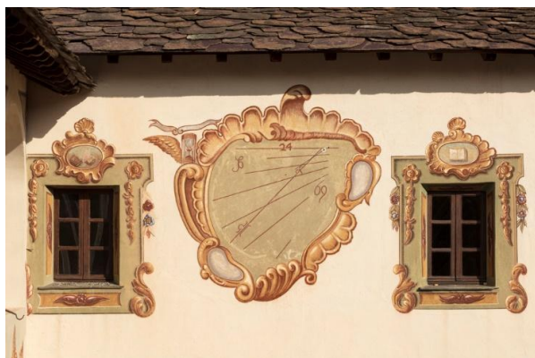
Cloître, cadran solaire

Le cloître et le réfectoire du monastère présentent des décors peints exceptionnels des XVII e et XVIII e siècles : fresques illustrant la vie de saint François d'Assise, allégories des vertus, trompe-l'œil et un magnifique ensemble de 9 cadrans solaires.