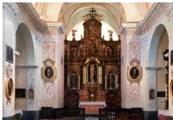
Eglise Notre Dame des Miracles du monastère

A la fin du XVIII e siècle, le monastère de Saorge connaît plusieurs périodes d'occupation (troupes révolutionnaires, hospice communal, garnisons etc). Acquis par l'Etat en 1967, il abrite de nouveau une communauté franciscaine de 1969 à 1988. Dans les années 2000 des travaux sont entrepris afin d'ouvrir le monument à la visite et de créer une résidence d'écriture pour auteurs, traducteurs et compositeurs qui s'est récemment ouverte à l'ensemble des disciplines artistiques.