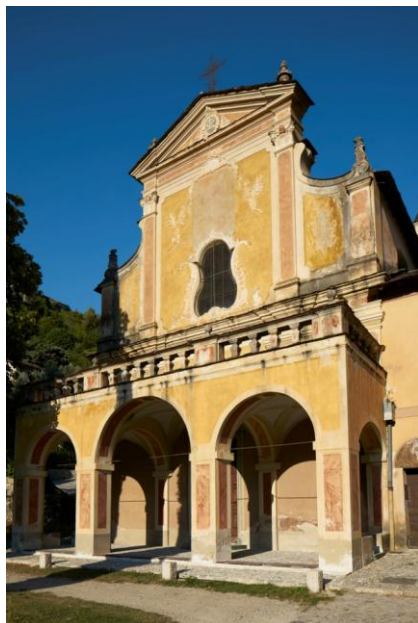
Façade du monastère de Saorge

Ancien couvent franciscain, aujourd'hui géré par le Centre des monuments nationaux, le Monastère de Saorge est un havre de paix qui accueille les visiteurs, et qui propose des résidences de création pour des auteurs et des artistes en quête de calme et d'inspiration.