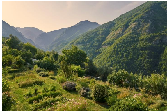
Jardin du monastère de Saorge

Le vaste jardin en terrasses architecturées complète harmonieusement cet ensemble, avec ses pergolas, ses oratoires, son verger et son potager, ouvrant sur les montagnes alentour.