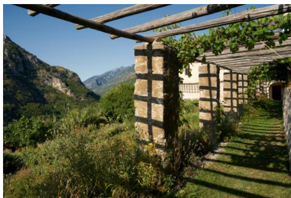
Pergolas, jardin du monastère

Il est aujourd'hui à la fois un joyau d'art baroque et un lieu unique dédié à la création contemporaine.