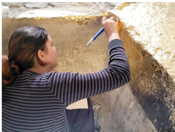
« Lux Aurea » de Georges Rousse, l'application des feuilles de cuivre