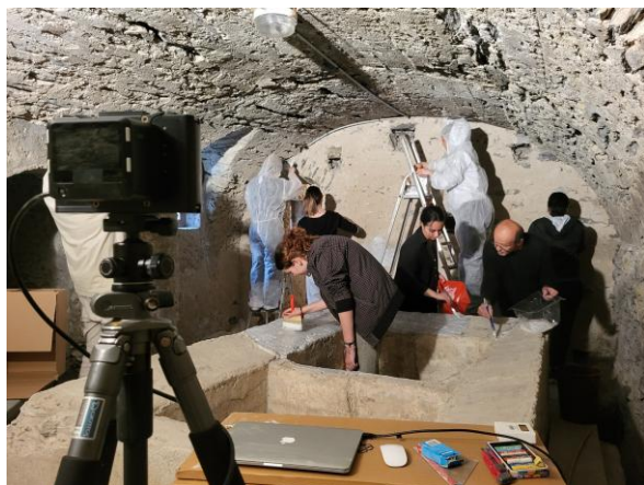
« Lux Aurea » de Georges Rousse, la préparation